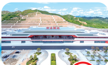
高铁商洛西站。