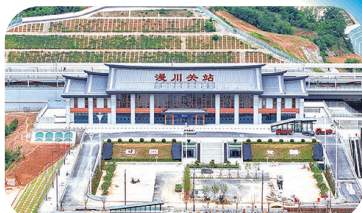
高铁漫川关站。

整座站房与千年古镇和谐共生、相得益彰,每一处悬山顶都在复述骡马店的吆喝,每一扇花格窗都映照着昔日水旱码头的帆影。