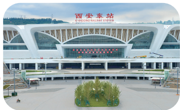
高铁西安东站。