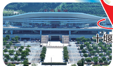
高铁十堰东站。

随着西十高铁开通,十堰正式嵌入“西安—十堰—武汉”高铁圈,其中十堰到西安1小时左右可达。