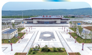
高铁蓝田站。

7座车站,7种表情——有13台27线的超级枢纽,也有3999平方米的镇级小站;有再现隋唐气象的千年玉乡,也有以“七夕”文化入景的秦楚门户。她们或巍峨、或雅致、或古朴、或灵动,共同讲述着一条高铁与一方水土的动人故事。 ■记者 何利