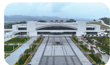
高铁山阳站。

站房以“峻岭崇山风光秀,平川美景画无边”为设计理念。候车大厅天花板上,流岭与鹁岭的蜿蜒山形在柔曲线条间徐徐铺展;站房整体造型呼应秦岭山势,将这座“天然氧吧”