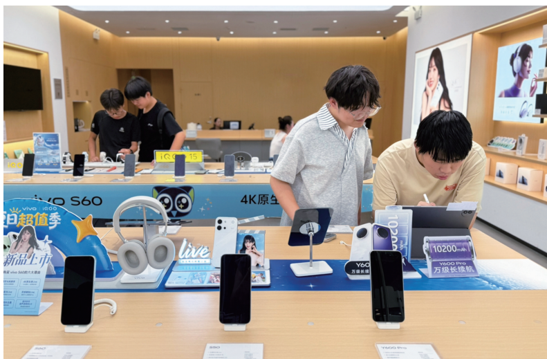
高三毕业生结伴选购数码产品。