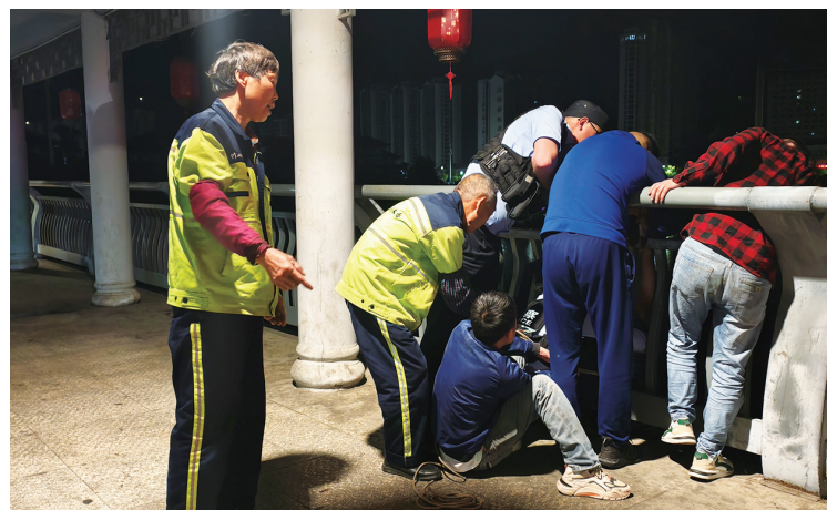
发现女子跳河后,三名环卫工积极施救。