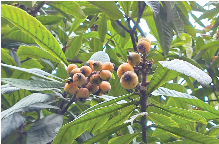
枇杷树上缀满了金黄的果实。