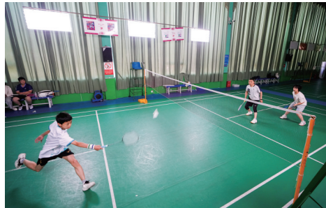
羽毛球爱好者挥拍对战。