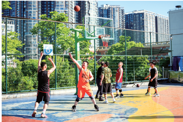
篮球场上挥洒汗水。

“五一”假期,市民运动热情持续高涨。城区各大体育馆里,篮球、网球、乒乓球、羽毛球等项目人气高涨,大家以运动健身的方式,度过一个充满活力的假期。