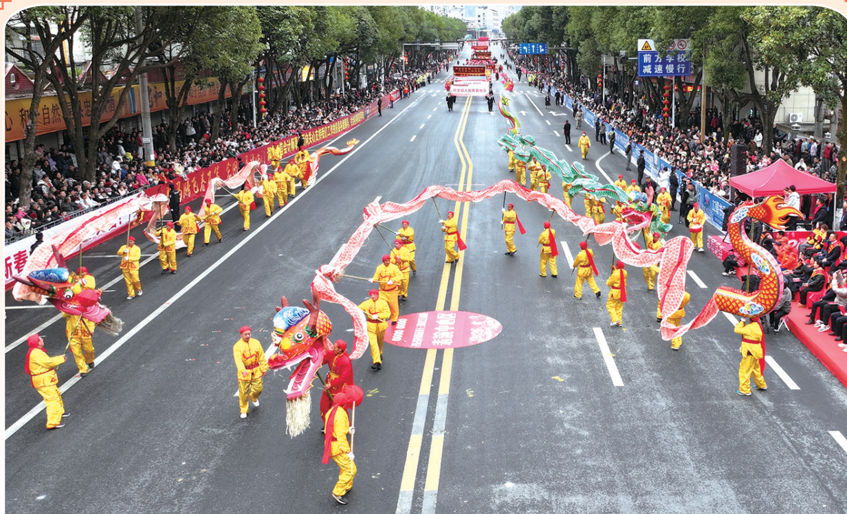
房县正月十三民间文艺大巡游成为一个独特的文化符号。