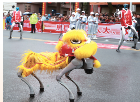
智能机器人、机器狗精彩亮相。