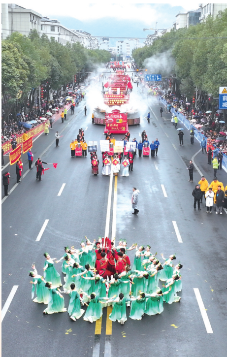
特色方阵沿街巡游,十分热闹。

锣鼓喧天闹新春,欢歌笑语满房陵。昨日上午,2026年房县正月十三民间文艺大巡游在唐城广场盛大启幕。这场民俗盛会以“诗酒美城 福满房县”为主题,2000余名演职人员组成46个特色方阵,沿着房县城区主干道踏歌而行。千年民俗的底蕴、现代科技的活力、万民参与的热情在此交融,让新春年味愈发醇厚,也让这座古城的文化魅力在欢腾中尽情绽放。