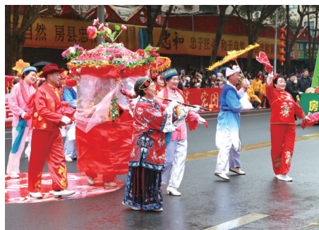
秧歌、划早船等民俗节目轮番上演。