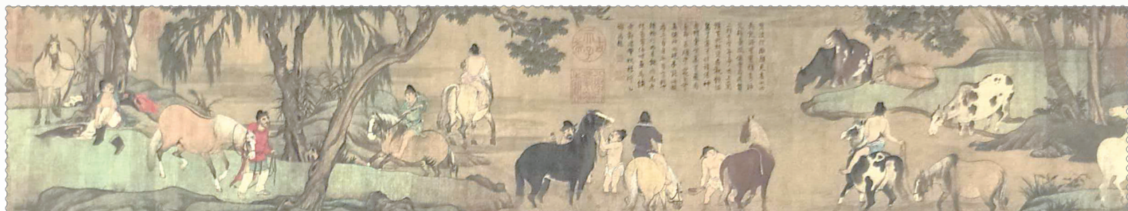
以元代画家赵孟頫的传世名画《浴马图》为原型设计的邮票。