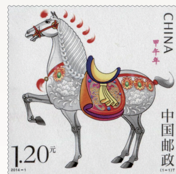
昂扬奔马,线条灵动。