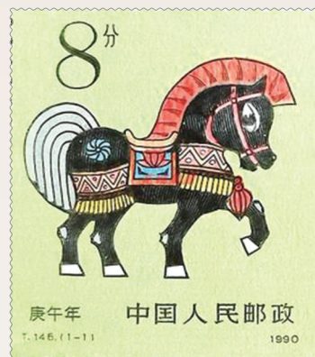
写意奔马 四蹄生风

《驿使图》小型张是联合国邮政管理局2026年1月16日发行的生肖马年邮票,灵感源自东汉“铜奔马”,背景融入敦煌藻井纹样,以现代插画与版画融合手法呈现,成为东方美学走向世界的窗口。吉尔吉斯斯坦突出“火马”意象,泰国用诗琳通公主卡通马,法国、新西兰融合本土风光与中国元素;列支敦士登邮政推出的《中国生肖马年》邮票,主图为草书“马”字,辅以篆刻印章,体现“文字山水”的艺术风格,小版张采用红底金字挥春设计,洋溢喜庆氛围。美国马年邮票:是纸雕风格的马面具,灵感来源于舞龙舞狮和剪纸艺术。