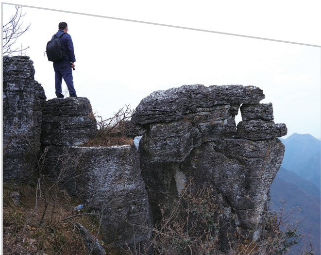
女花寨被户外爱好者亲切地称为“丹江口的小张家界”。