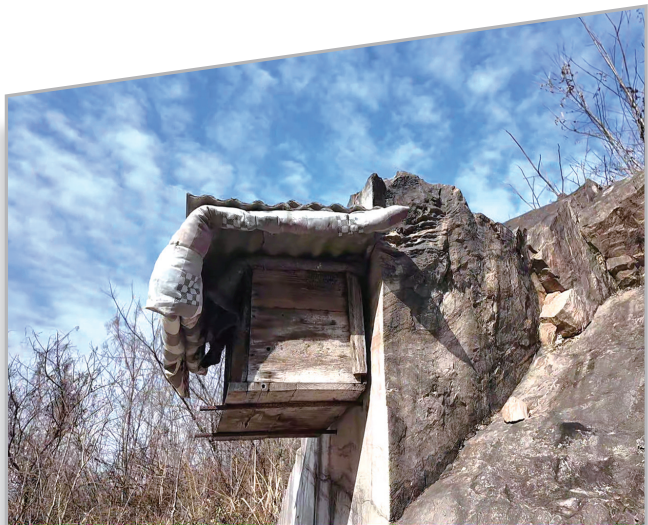
崖壁上的蜂箱，见证着村落古朴的农耕生活。