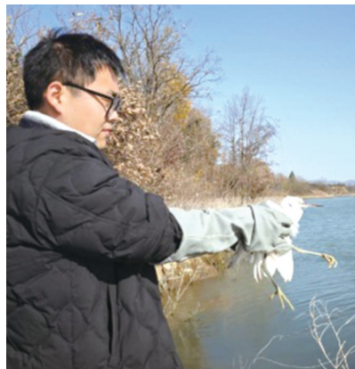
放飞恢复活力的白鹭。