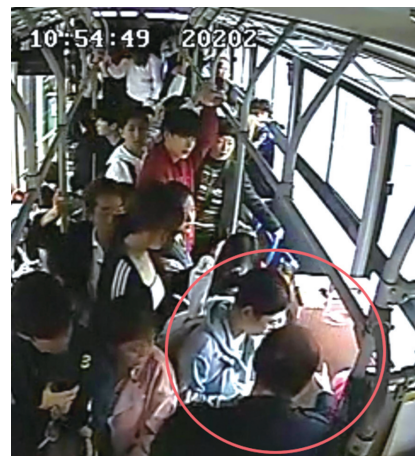
司机扶患病女乘客下车。