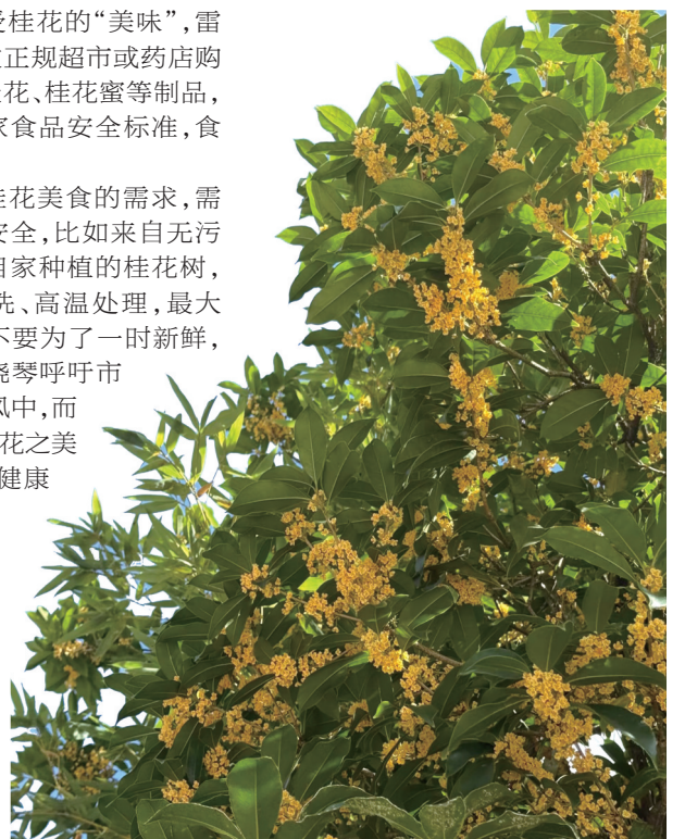
金秋时节,桂花开满枝头。

市园林部门也提醒,桂花是城市公共观赏植物,随意采摘会影响树木生长、破坏城市景观,希望市民共同爱护,文明赏花。