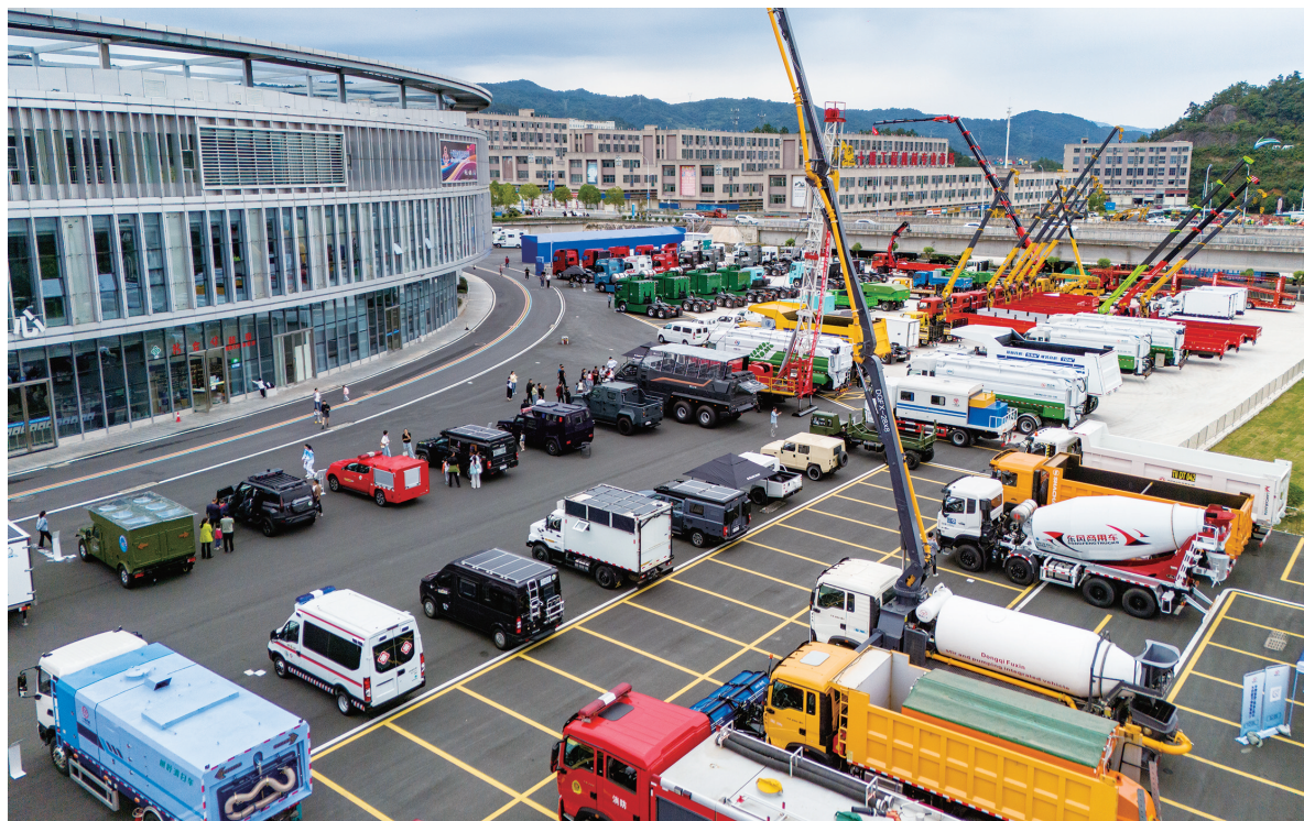
各式新品整车在户外展示。