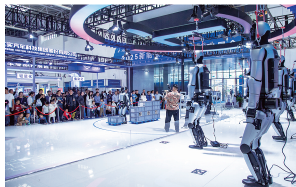
机器人展台吸引众多嘉宾驻足参观。