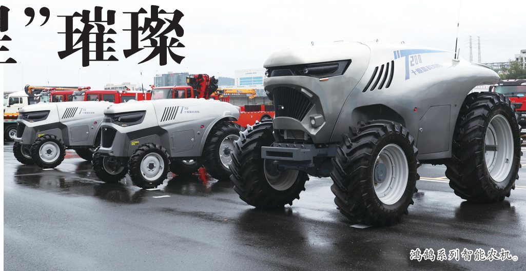
鸿鹤系列智能农机。