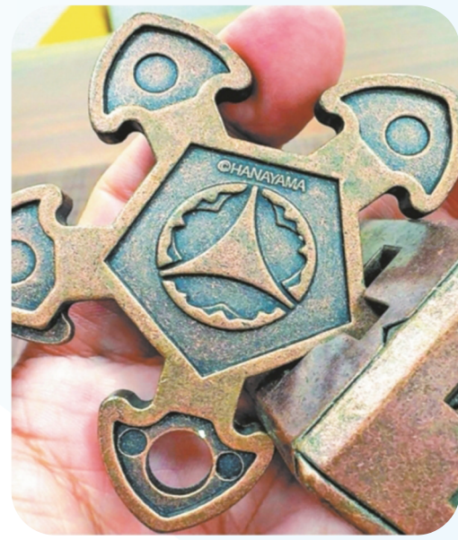
做旧的设计很有质感。