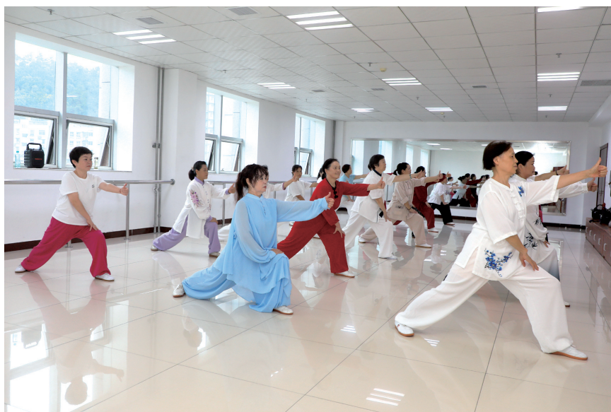
学员们认真练习木兰拳。