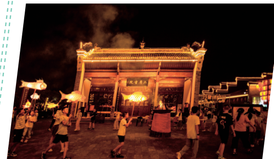
在上庸镇三盛院参加鱼灯表演。