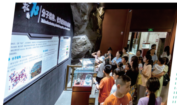
在博物馆深入了解绿松石的形成过程。

官渡秦巴民俗风情苑—武陵峡风景区—圣水湖度假区—千绣花海—九女峰国家森林公园—桃花源街区