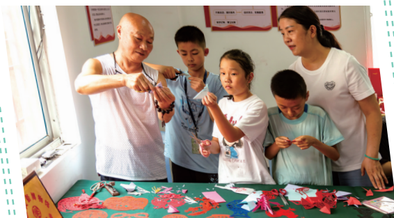
非遗传承人教授竹山剪纸技艺。