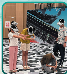
数字科技沉浸体验