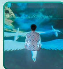
巨幕影视震撼视听