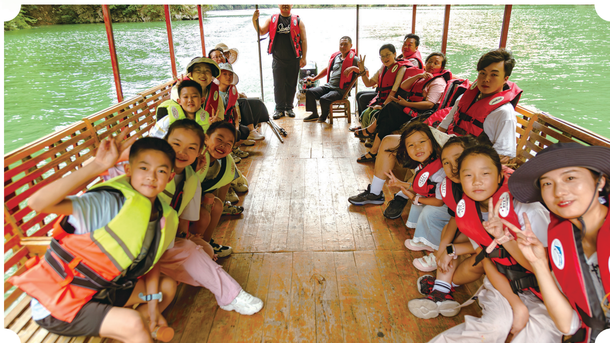
乘竹筏畅游武陵峡风景区。