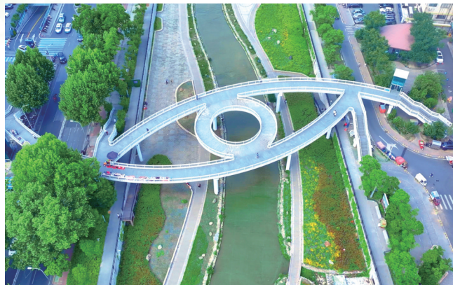
人民医院桥,别名“风之眼”。