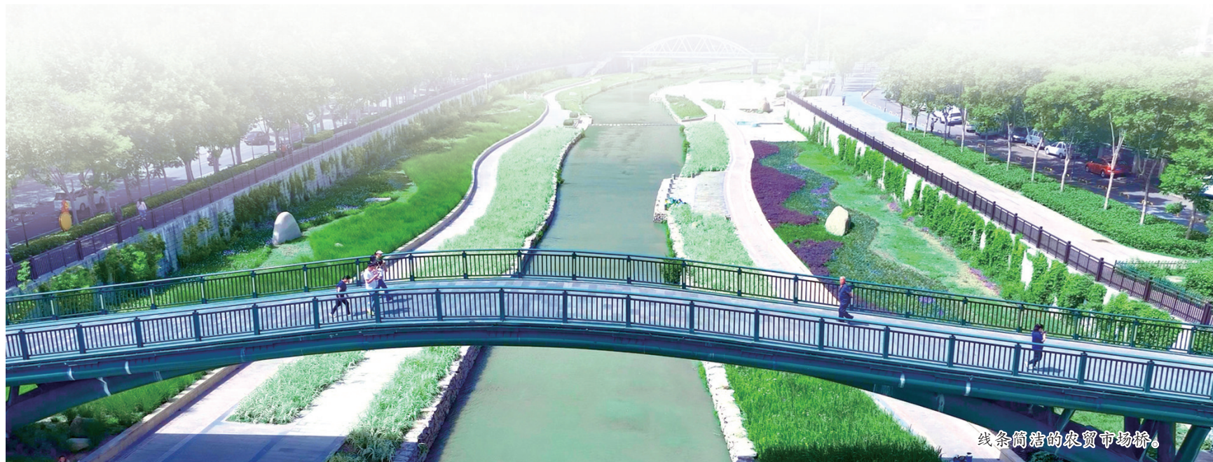
线条简洁的农贸市场桥。