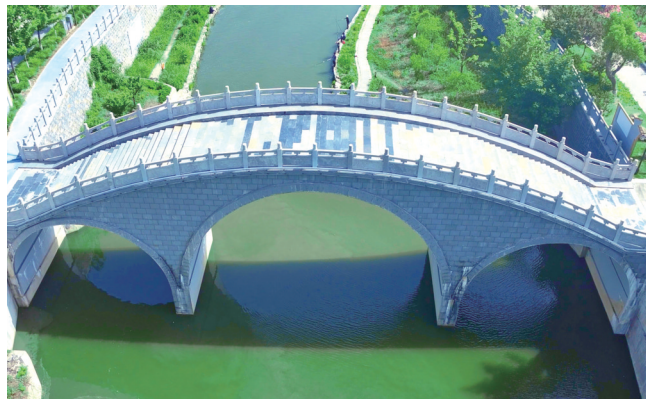
造型优雅古朴的头堰桥。