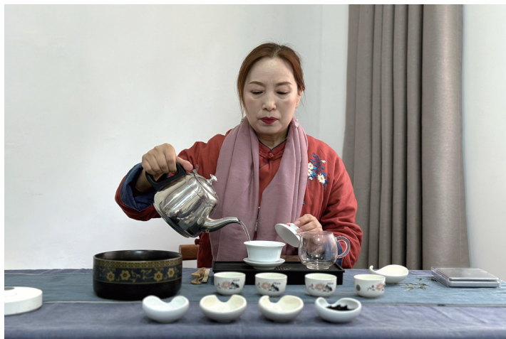
学员学习品茗论道。