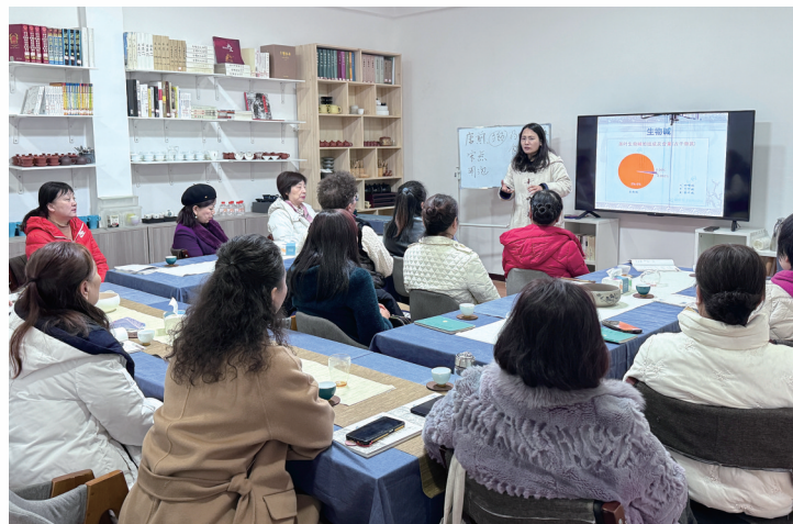
老年学员认真听讲,学习劲头十足。