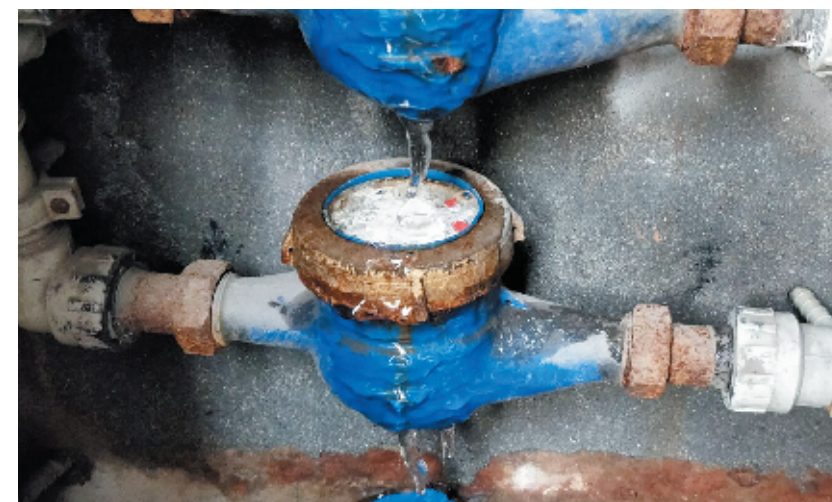
双鸥小区多处水表被冻坏。