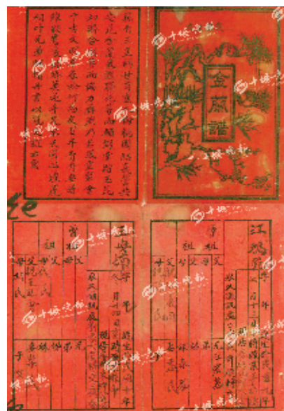
民国时期的金兰谱多数属于印刷品。