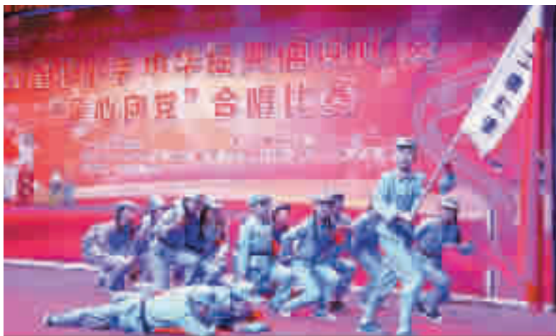
中华经典诵读比赛现场。

合唱比赛中,市五堰小学合唱的曲目《听妈妈讲那过去的事情》、《街头少年合唱》获小学组第一名;市一中合唱的曲目