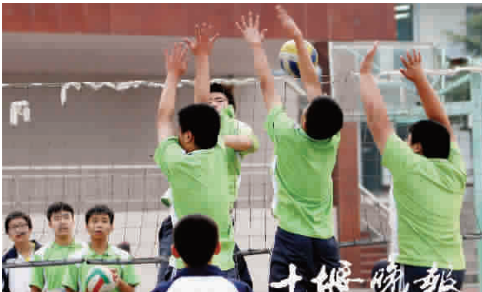
学生被分为两组,一组练习扣杀,一组练习拦网。