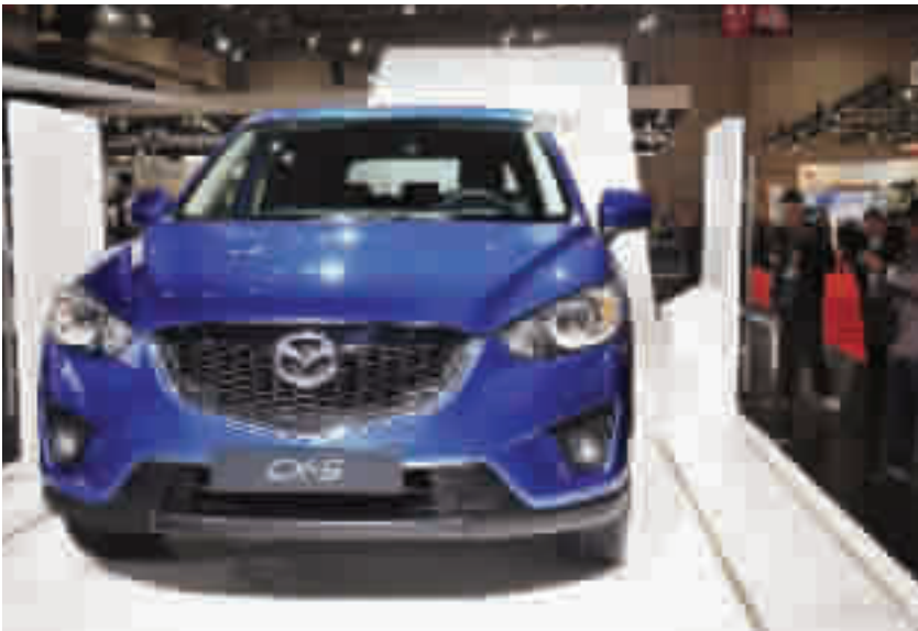
长安马自达CX-5获“年度梦想车之新锐动感大奖”。

国产CX-5将于7月中旬现车到店，欢迎莅临长安马自达十堰美泽店(十堰浙江路万通工业园七里坪路口)赏车，更多详情请致电：0719-8289777