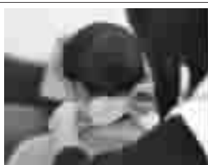
贴颈部:僵硬、麻木、疼痛感消失,不恶心、不头晕等