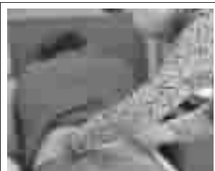
贴腰部:腰酸痛、腿放射性疼痛减轻到消失,椎管狭窄、腰肌劳损等得到修复