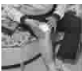
贴小腿和膝盖:晨僵消失,骨质增生压迫的疼痛感消失,能走,能跳,行动方便。