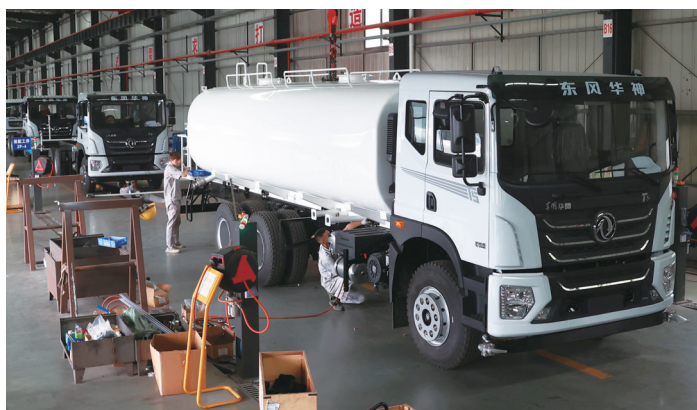
纯电动自装卸式垃圾车下线。