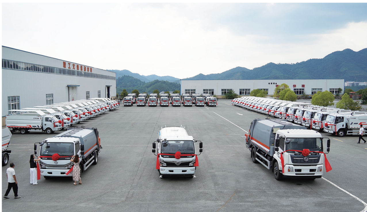
纯电动自装卸式垃圾车整齐排列,即将投用。