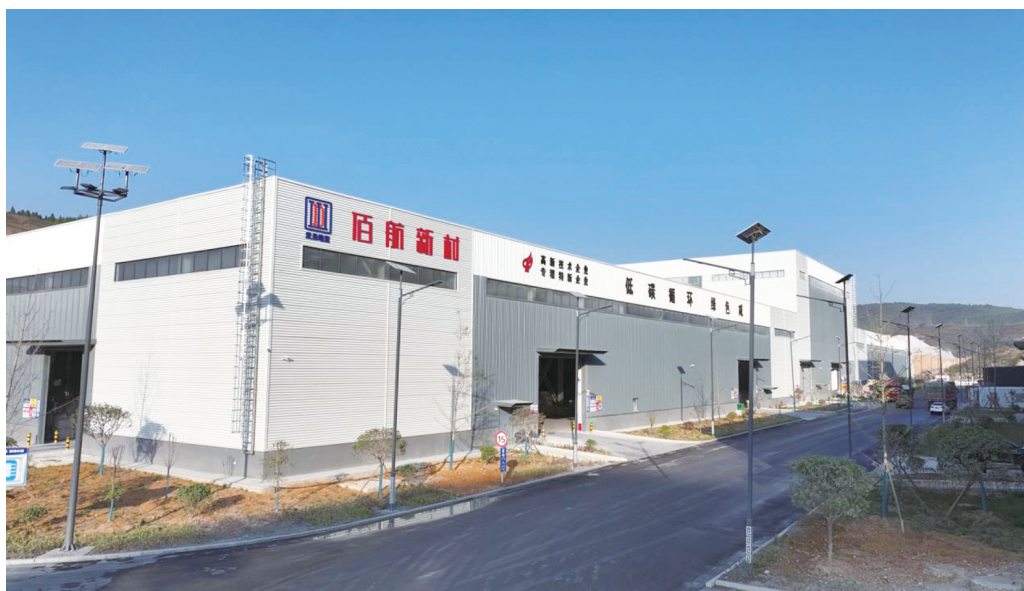
佰航新材郧阳区新厂区