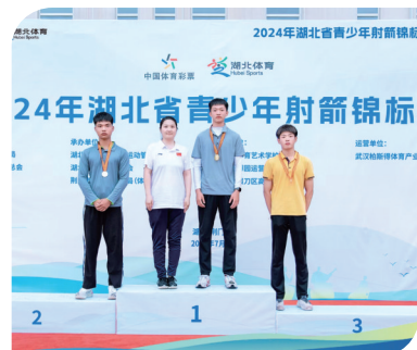
东风50学校学生参加2024年湖北省射箭锦标赛获得冠军。

近年来,经开区将“汽车文化”引入校园,通过“进课堂、进课本、进头脑”,助力十堰汽车文化产业发展。2024年,区龙门小学“妙剪梦工坊”入选湖北省第十三届黄鹤美育节展演;在各类艺术、体育比赛中,众多学生成绩优异,彰显了学校特色教育成果。(本版图片均为资料图)