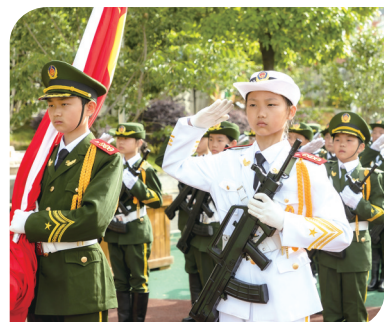
龙门小学开展国防教育。