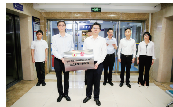
十堰首家!太和医院成为中国造血干细胞捐献者资料库定点采集移植医院。

作为我市儿科“充分问诊”试点医院,太和医院通过限定专家号源、延长沟通时间,将儿科门诊变成“有温度的诊疗场域”。这里的医生用平均6分钟以上的问诊时间,让每个患儿的健康故事都得到完整倾听。 今年以来,太和医院深化检查检验结果互认,惠及3000余人次,为患者节省费用近百万元。 一次挂号管三天、温暖异地就医、关爱特殊群体、开展“免陪护”试点、深化老年友好医院建设、新增孤独症患儿门诊诊疗中心、拓展日间医疗服务……每一次服务的升级,都为让患者就医更轻松。 六十年仁心济世,三十载笔墨