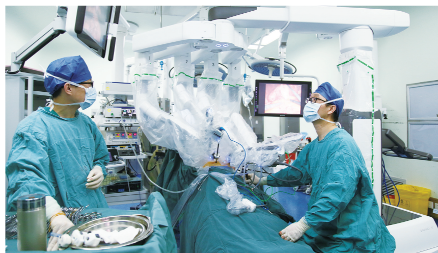
达芬奇机器人手术。