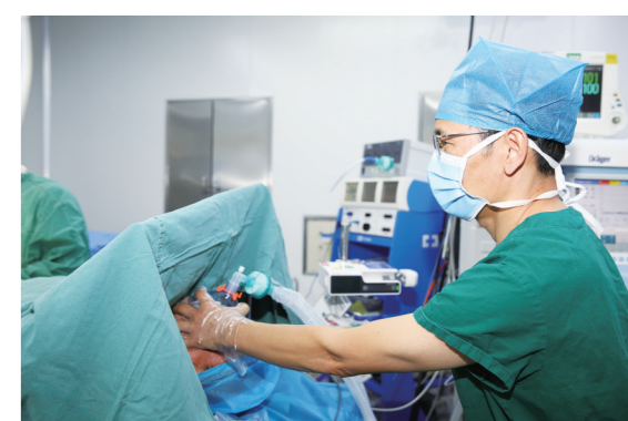
太和医院麻醉科获批国家临床重点专科建设项目。