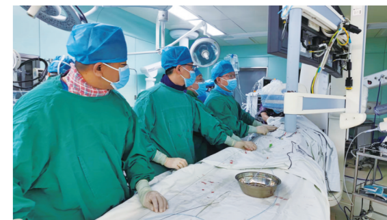
太和医院胸心大血管外科TAVR手术。