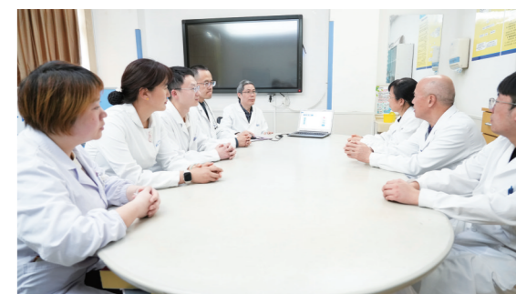
全国首例!太和专家改造T细胞成功治疗特殊血管炎。