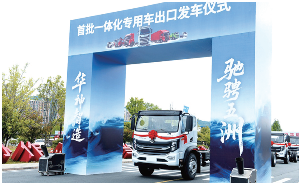
十堰首批一体化专用车集中发车将出口拉丁美洲,标志着东风华神与东风进出口公司在海外市场拓展中取得新进展。