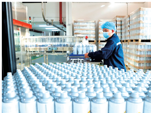
3月14日,位于张湾区拾光二〇双创园的燕京啤酒张湾工厂,一瓶瓶精酿啤酒陆续灌装下线。