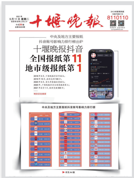
十堰晚报抖音号屡获殊荣、屡创新高。