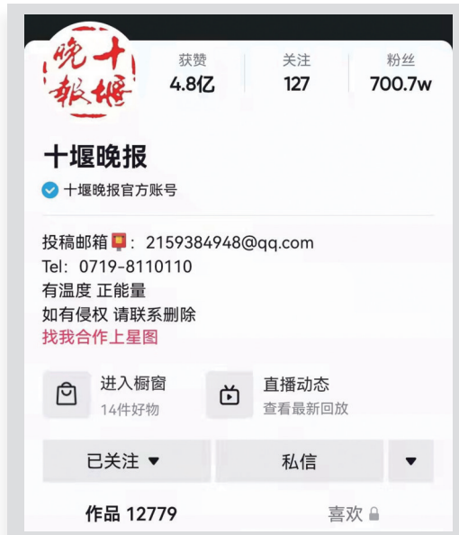
十堰晚报抖音号粉丝最高曾突破700万。