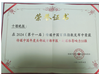
荣获传媒中国年度头部城市都市报·新媒体影响力10强。