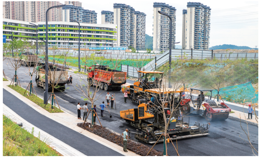
施工人员在山东路(厦门路段)摊铺面层沥青。