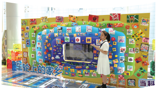
市柳林幼儿园教联体教师向观展游客介绍孩子们的课程成果。