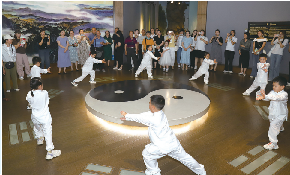
孩子们表演太极拳。