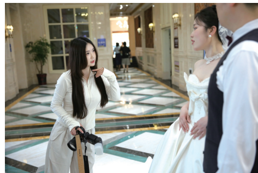
拍摄过程中,浮叶不断鼓励引导新娘。

夜幕降临,浮叶终于结束了一天的工作。电脑屏幕上,最后一张修好的照片是新郎新娘携手走向幸福大门的画面。“这就是我热爱这份工作的原因,”她轻轻地说,“用镜头替别人留住生命中最美好的时刻,是件很幸福的事。”