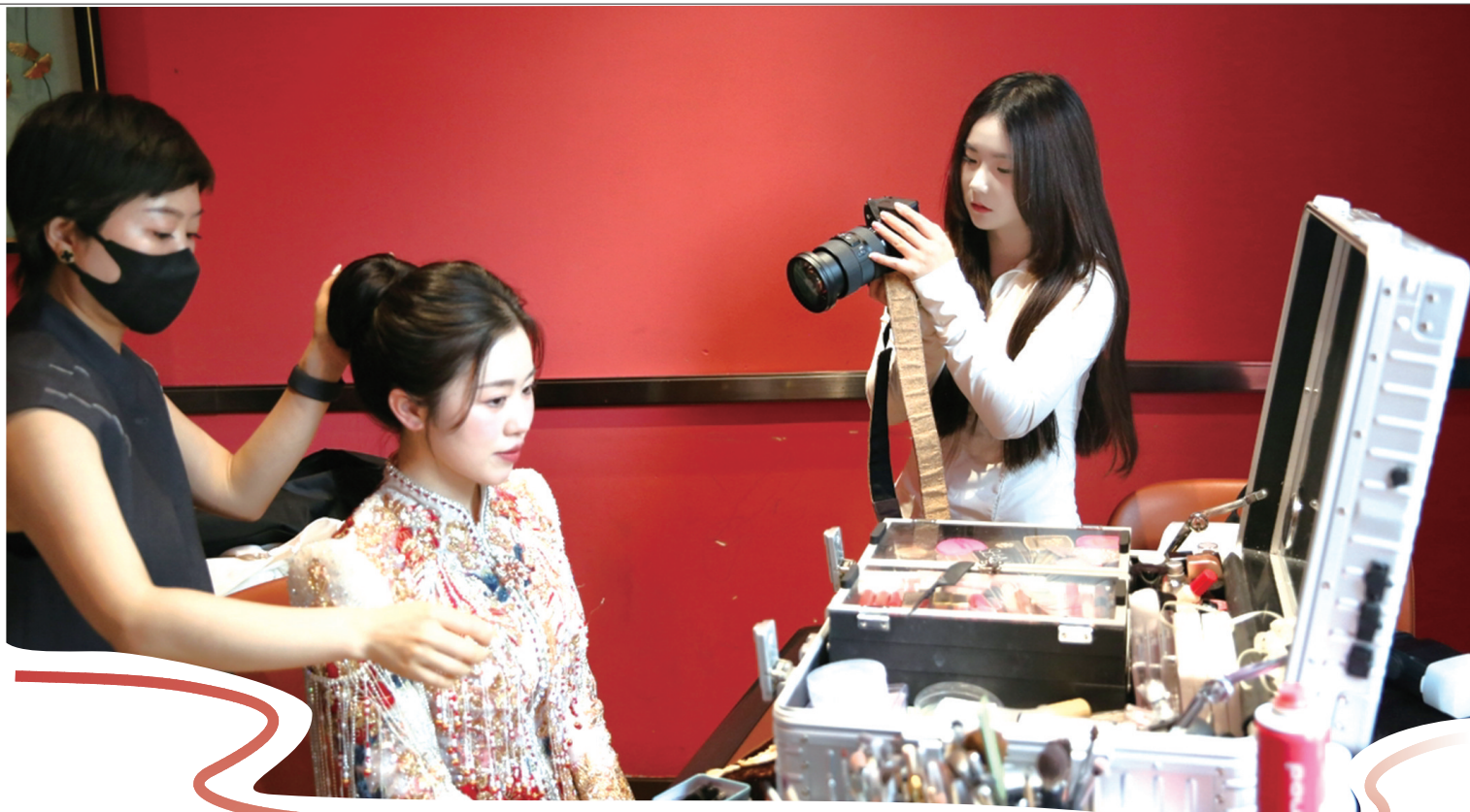
浮叶心思细腻,善于捕捉人物间的细微情感。