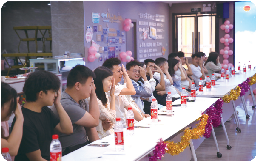
交友会现场气氛热烈。

青春涂鸦刮刮乐环节,男女嘉宾随机抽取涂鸦卡,手持竹笔刮画,刮出相似图案者自动结成一组并调整座