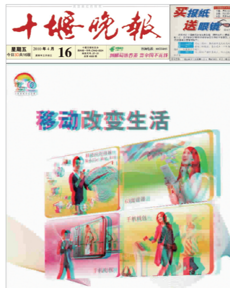
2010年4月16日,中国报业史上首份3D报纸。