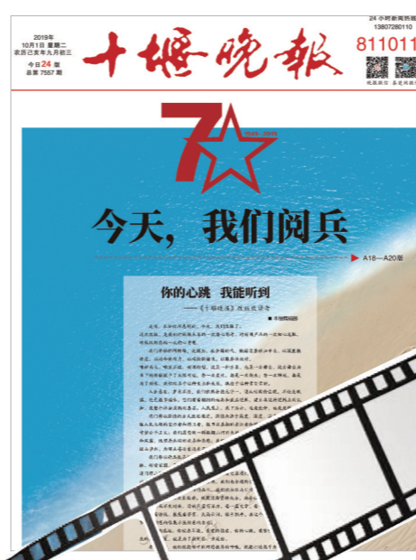
2019年10月1日,《十堰晚报》全新亮相。