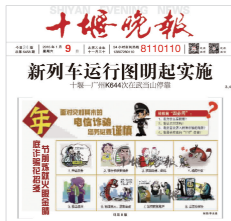
2016年1月9日,《十堰晚报》再次改版。