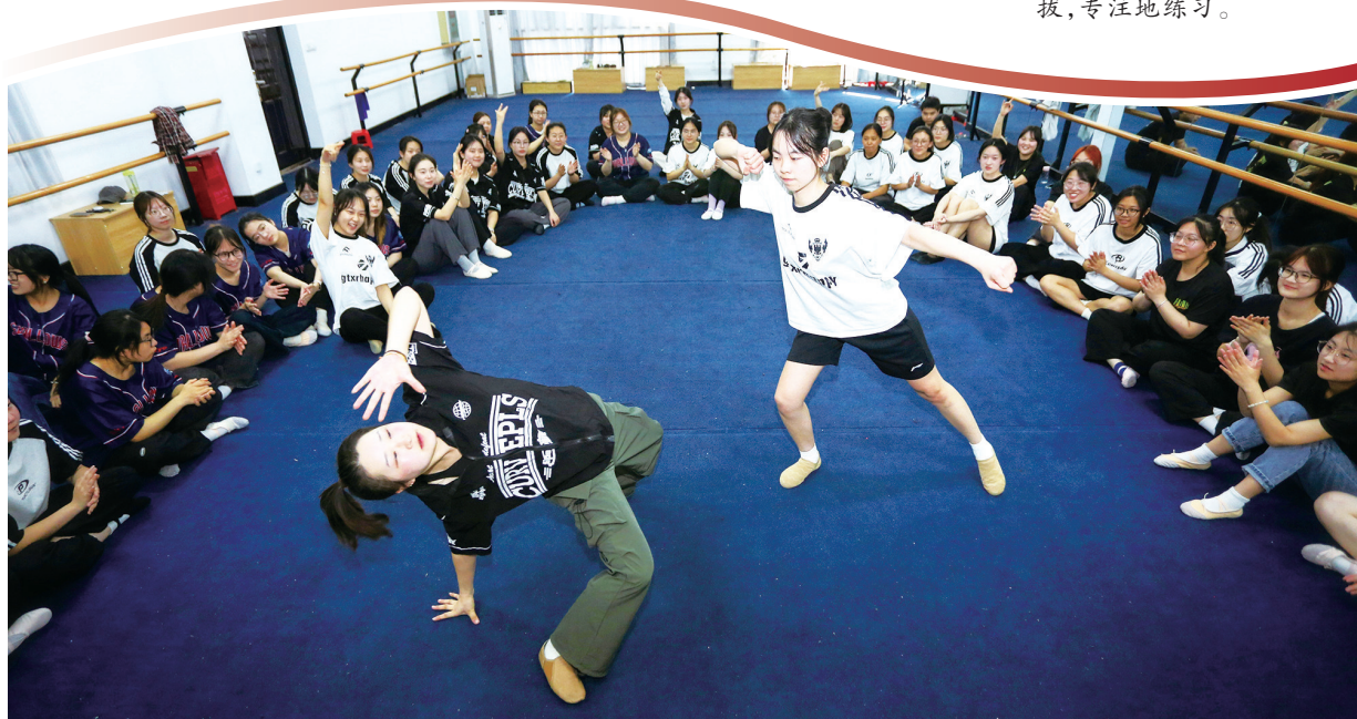
街舞课最受欢迎的Battle(斗舞)环节,同学们轮流展示,其他人则用掌声和欢呼给予鼓励。