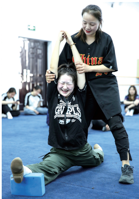
高难度的热身环节。

据介绍,特色舞蹈课程一经推出,每学期总是最先被抢光。街舞的动感、拉丁的热情、华尔兹的优雅,在校园里交织成一曲青春乐章。