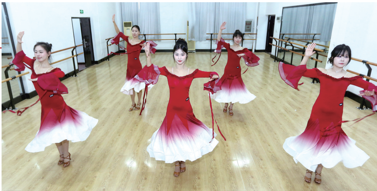
华尔兹课,学生们体态优雅,专注地练习方步和旋转。