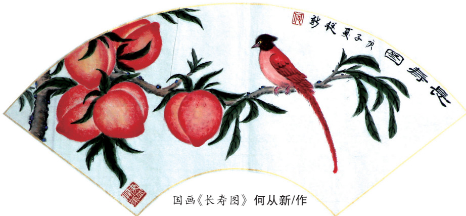
国画《长寿图》 何从新/作