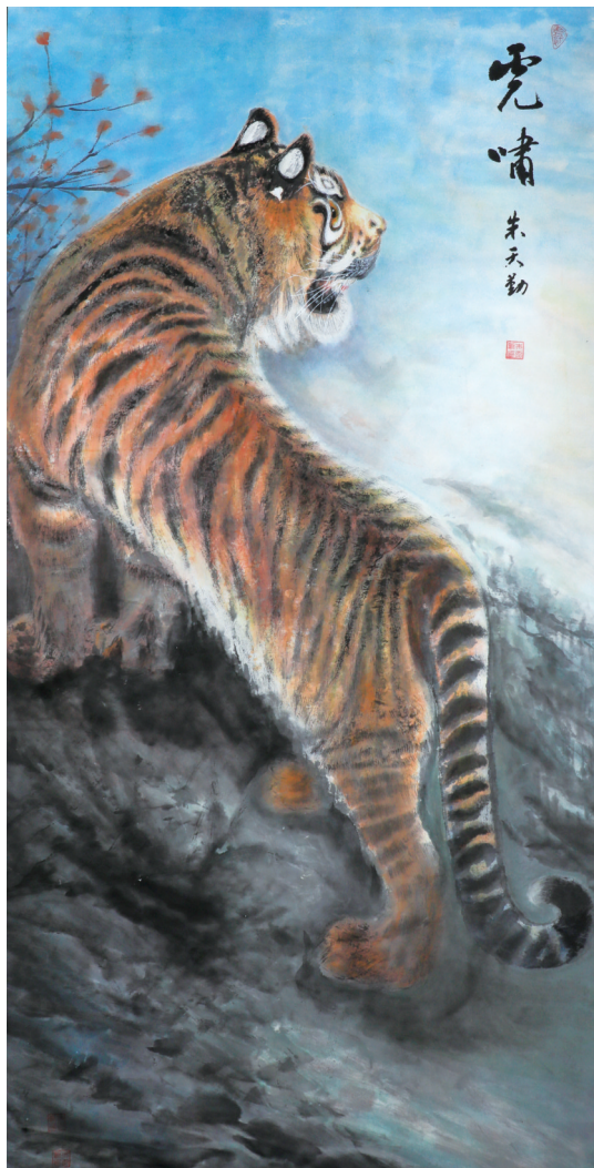
国画《虎啸》 朱天勤/作