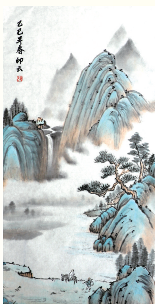
中国画《乙巳年春》 印云作