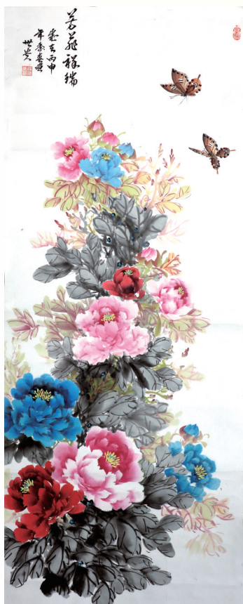
中国画《芳菲祥瑞》 杨世贵/作