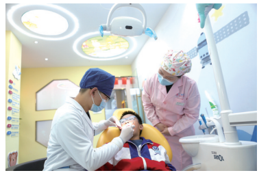
为儿童进行牙齿涂氟。