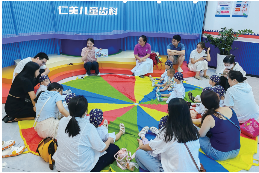
仁美口腔开展公益活动,回馈社会。