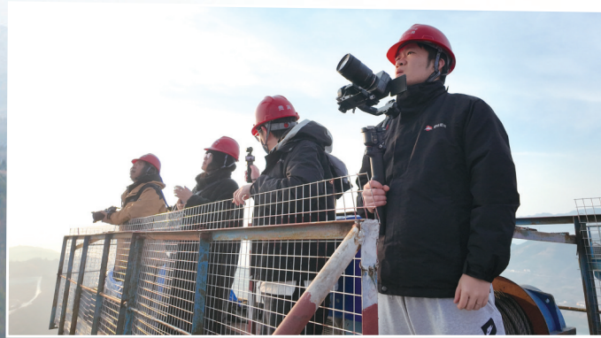
记者一行到达塔顶钢梁。