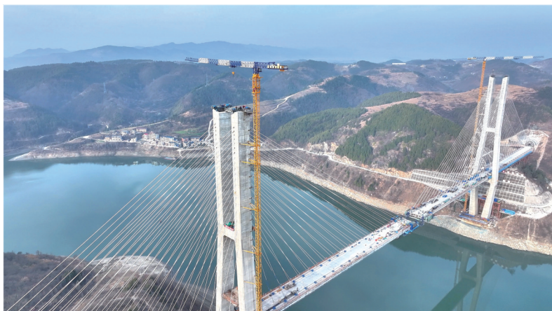
西十高铁汉江特大桥下方，汉江蜿蜒远去。