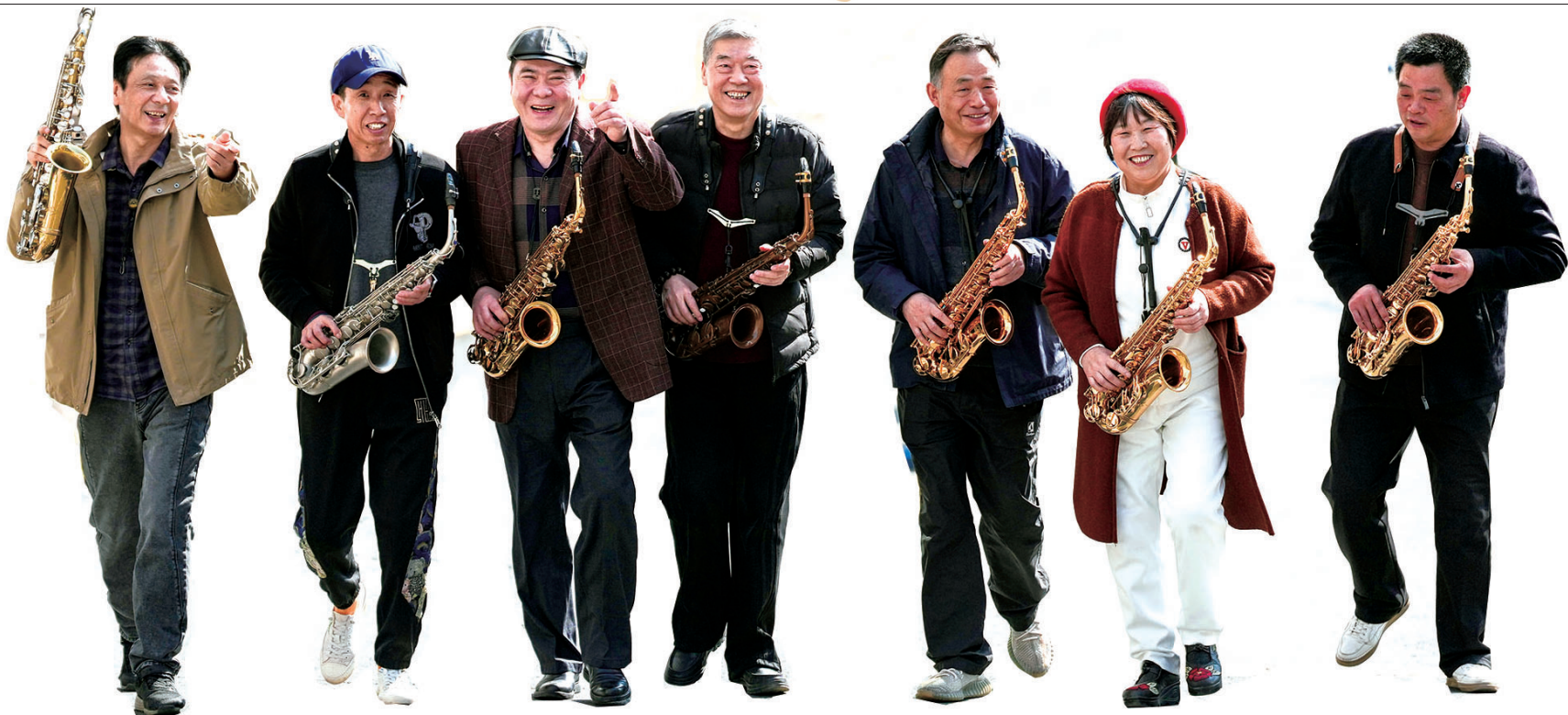
一场合练结束后,大家边走边聊,脸上洋溢着满足和喜悦的笑容。