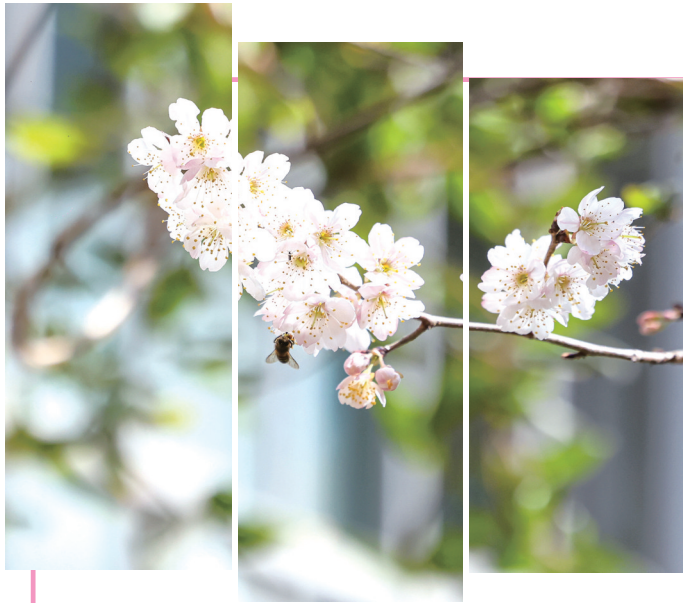
2月25日,位于市城区东岳路鱼郡小区的一株樱花开放,一团团、一簇簇傲立枝头。