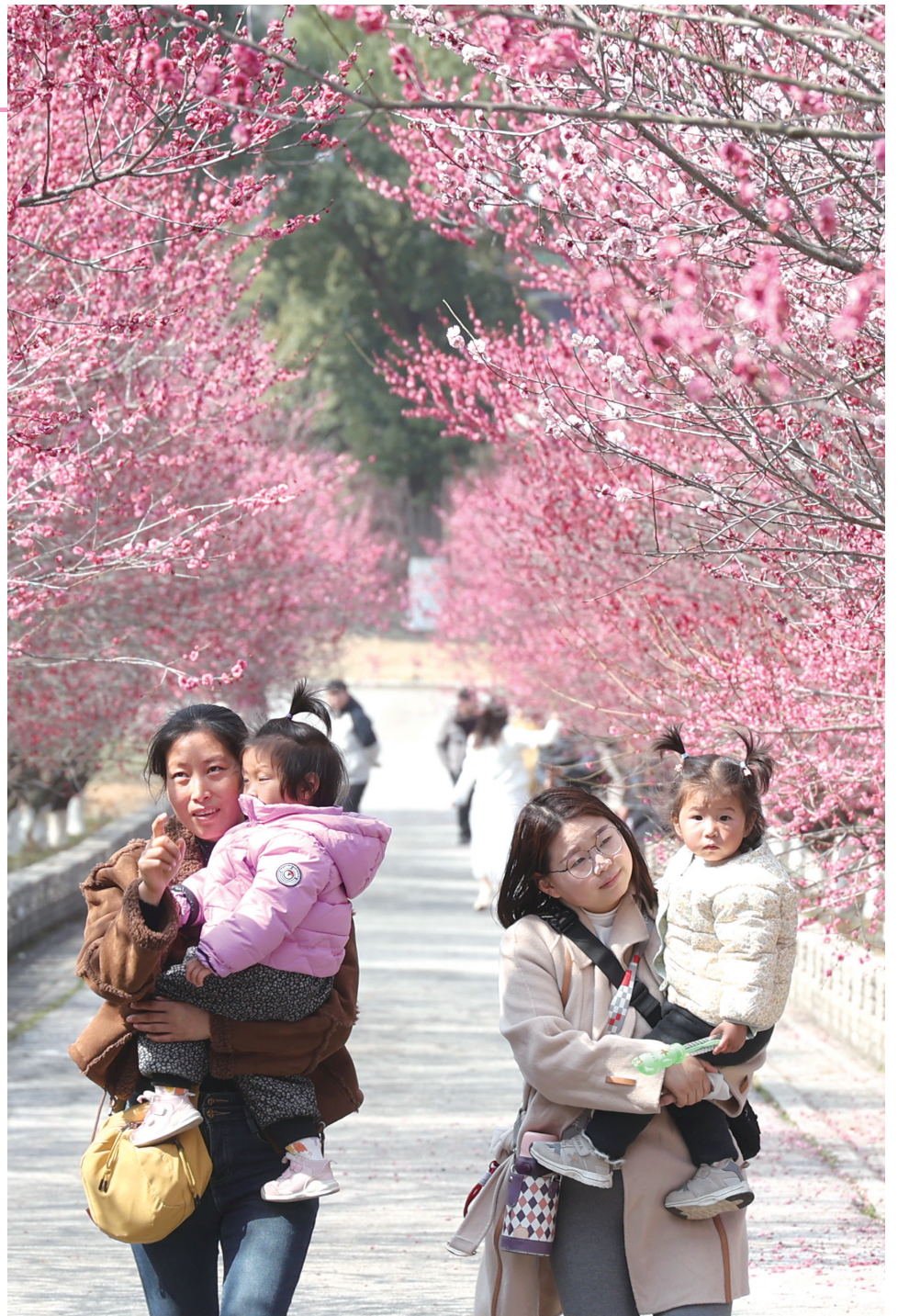
2月25日,秦巴生态植物园红梅盛放如云,游客穿梭林间踏青赏花。图/记者 张启国

春回大地,万物复苏。不仅是季节的更替,更是一次生命的觉醒。在这个充满希望的季节里,每一朵花开都是对大地的礼赞,每一缕春风都是对生命的祝福。