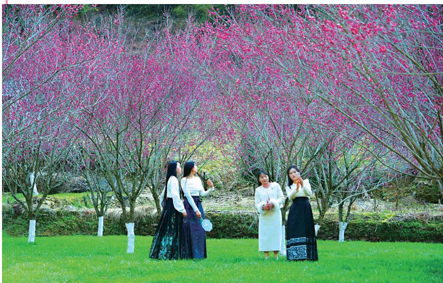
位于竹山县文峰乡的太和梅花谷红梅盛开,游客纷至沓来。