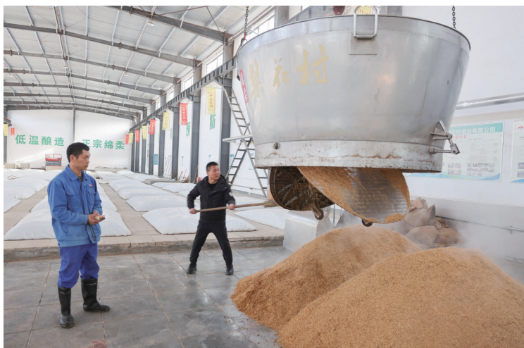
昨日,湖北梨花村酒业开启复产复工模式,酿酒及灌装生产线上一片热火朝天的繁忙景象。

新春伊始,万象更新。在浓浓的年味尚未散去之际,我市各企业纷纷奏响复工复产的激昂乐章,全力以赴抢生产、赶订单、抓进度,向“支点建设”聚焦聚力,奋力冲刺新春“开门红”。