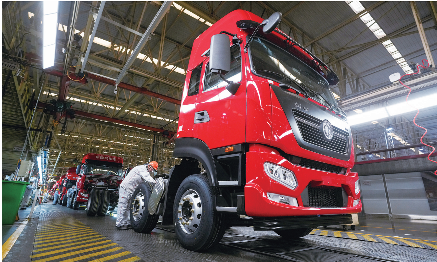
2月4日,东风商用车有限公司整车工厂内一片繁忙景象,随着新春首辆东风商用车下线,正式拉开蛇年生产的大幕。图/记者 刘成臣

新春伊始,万象更新。在浓浓的年味尚未散去之际,我市各企业纷纷奏响复工复产的激昂乐章,全力以赴抢生产、赶订单、抓进度,向“支点建设”聚焦聚力,奋力冲刺新春“开门红”。