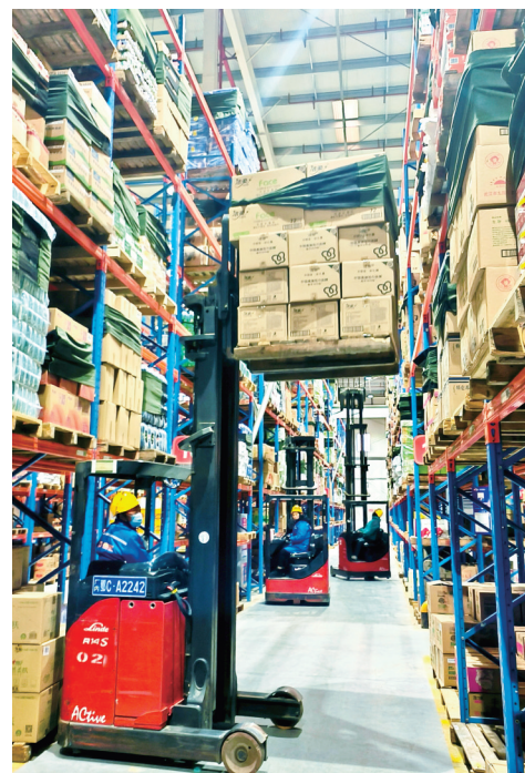
▶昨日,湖北寿康永乐商贸集团有限公司长岭物流配送中心仓库内,工人驾驶高叉车对货物进行分拣。