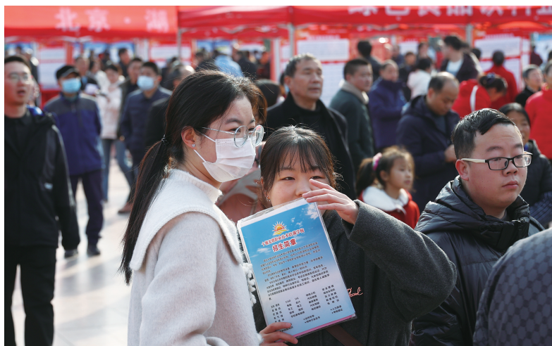
招聘会吸引了众多求职者。