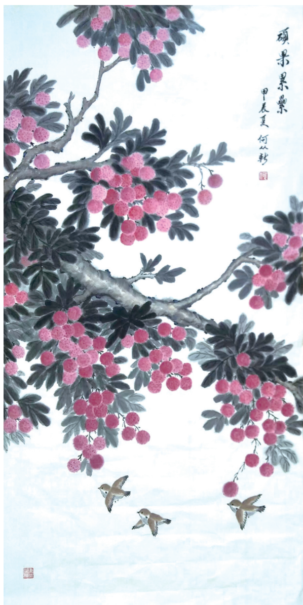
中国画《硕果累累》 何从新