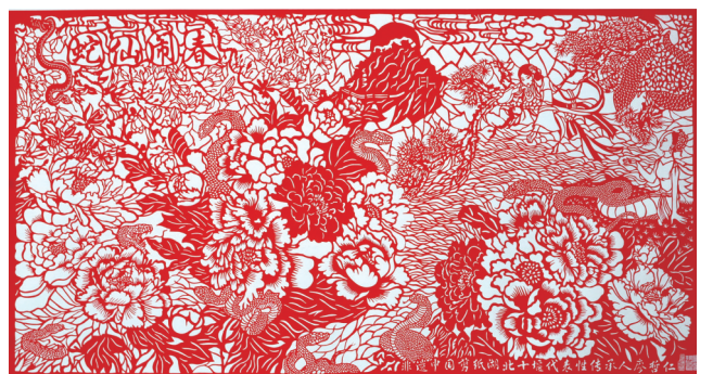
剪纸《蛇仙闹春》 廖哲仁