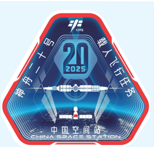
神舟二十号载人飞行任务标识

融合传统与创新,以稳定三角形为基,象征航天人在经验基础上攀登新高峰。外框红色传承载人飞行使命,内部深蓝寓意浩瀚太空。主体神舟飞船径向对接空间站,太阳翼巧构中文“廿”字(即“二十”)。