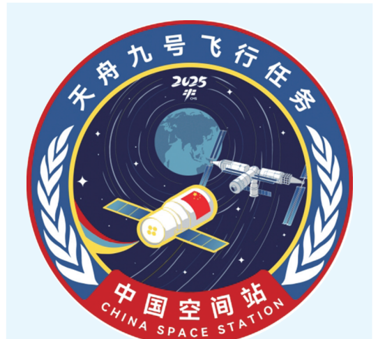
天舟九号飞行任务标识

设计巧妙,以航天员头盔为视角,凸显“人”作为宇宙探索的主体。航天员形象代表中国航天人的奋斗与奉献,与载人航天任务紧密相连。