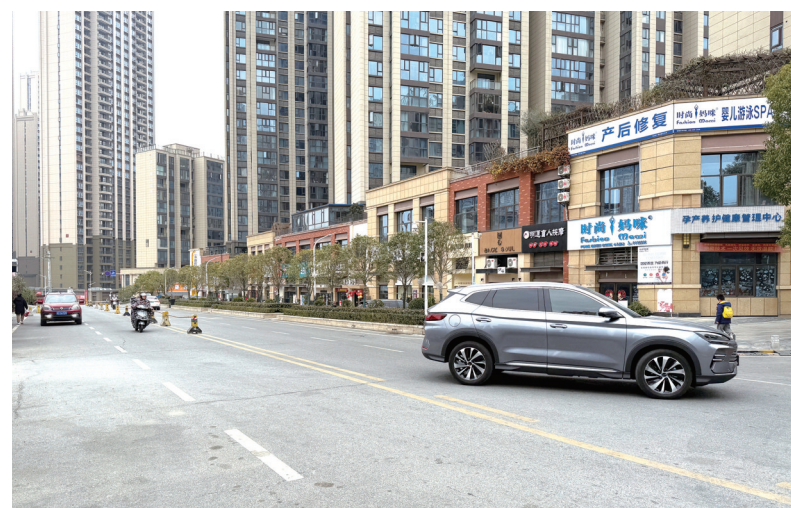
柳中路两旁已没有车辆违停。