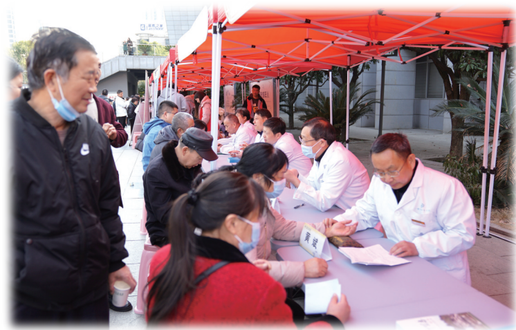
专家现场为市民义诊。