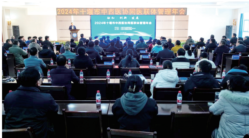
12月28日,市中西医协同医疗联合体管理年会召开。

市卫健委党组书记王斌对十堰市中西医协同医疗联合体暨市中西医结合医院建院55周年表示祝贺。王斌表示,市中西医结合医院作为中西医协同医联体的牵头单位,借助医