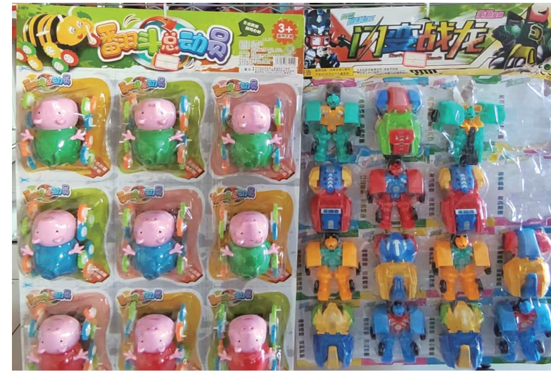
陈列的玩具都是“三无”产品,质量差。