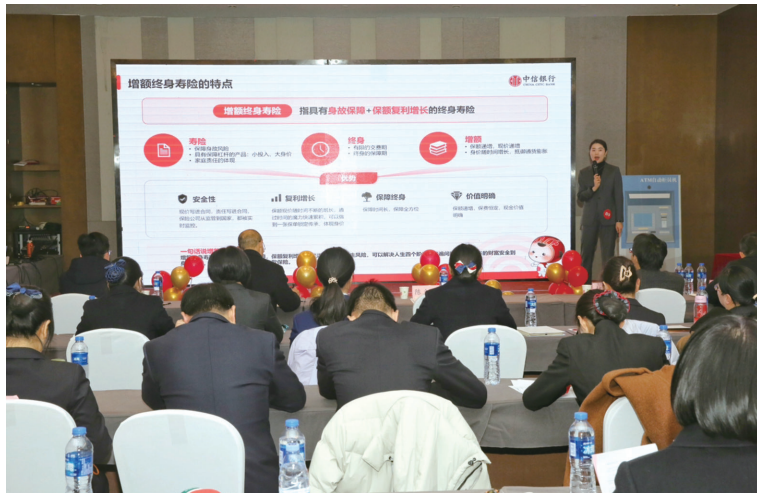
选手现场讲解金融产品特点,展示个人素养。

据悉,十堰银行业“最美大堂经理”评选活动已举办4届,旨在打造行业服务标杆。此次活动集中展现了十堰银行业在提升服务质量、创新服务模式等方面的显著成效,也展现了行业新生力量。未来,十堰市银行业协会将持续推动行业宣传与交流,助力银行业在新时代背景下稳健发展,为地方经济注入更强劲动力。